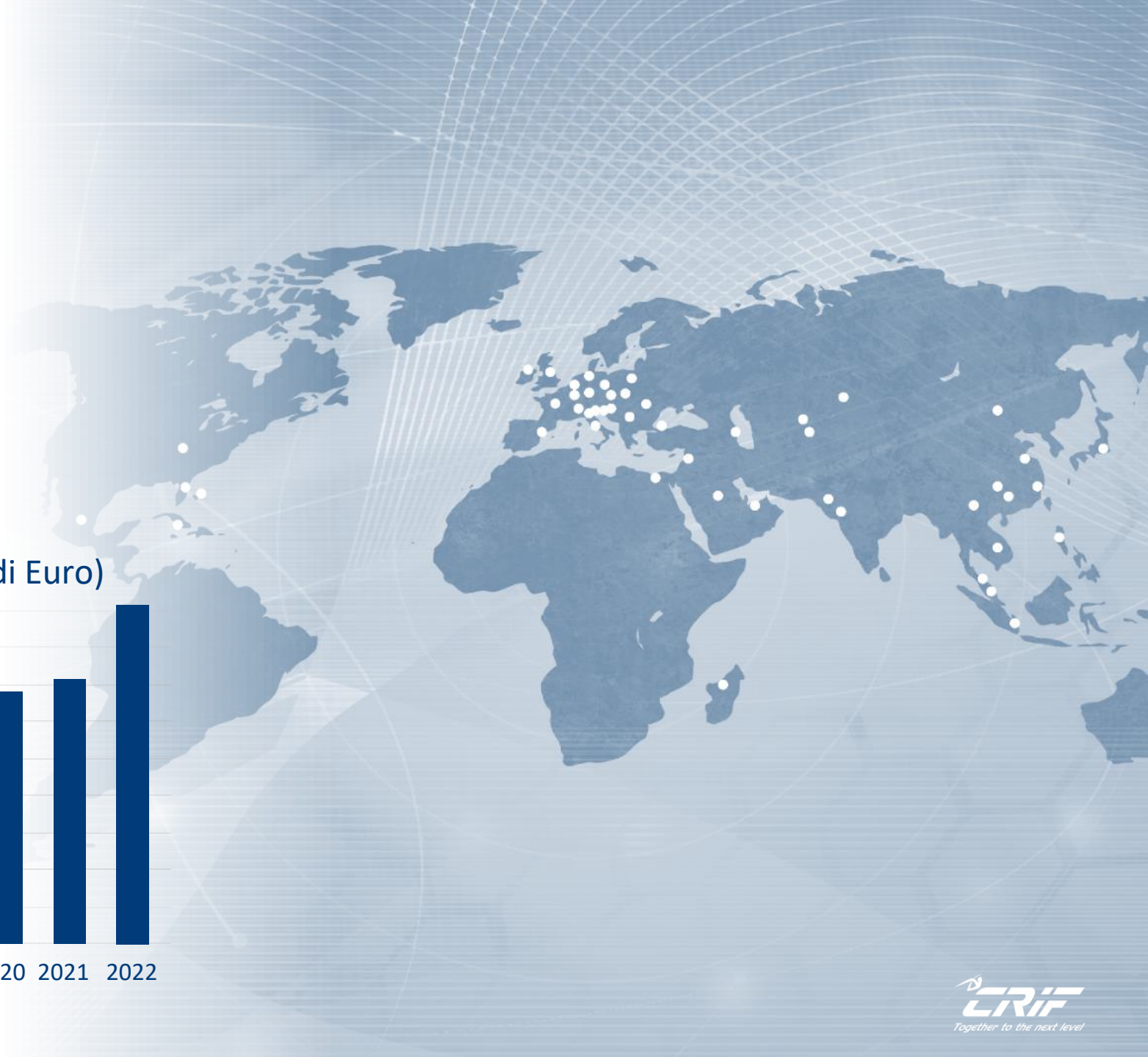
VALORE DELLA PRODUZIONE (milioni di Euro)